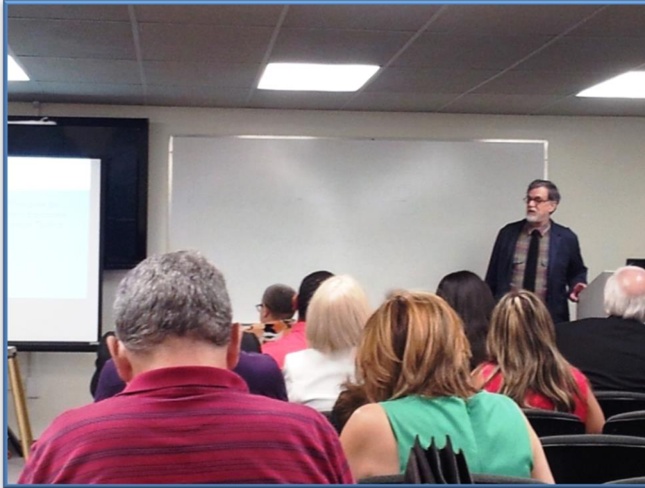
Lanzamiento de los Seminarios del Pacto Global de las Naciones Unidas. (13-12-2013)